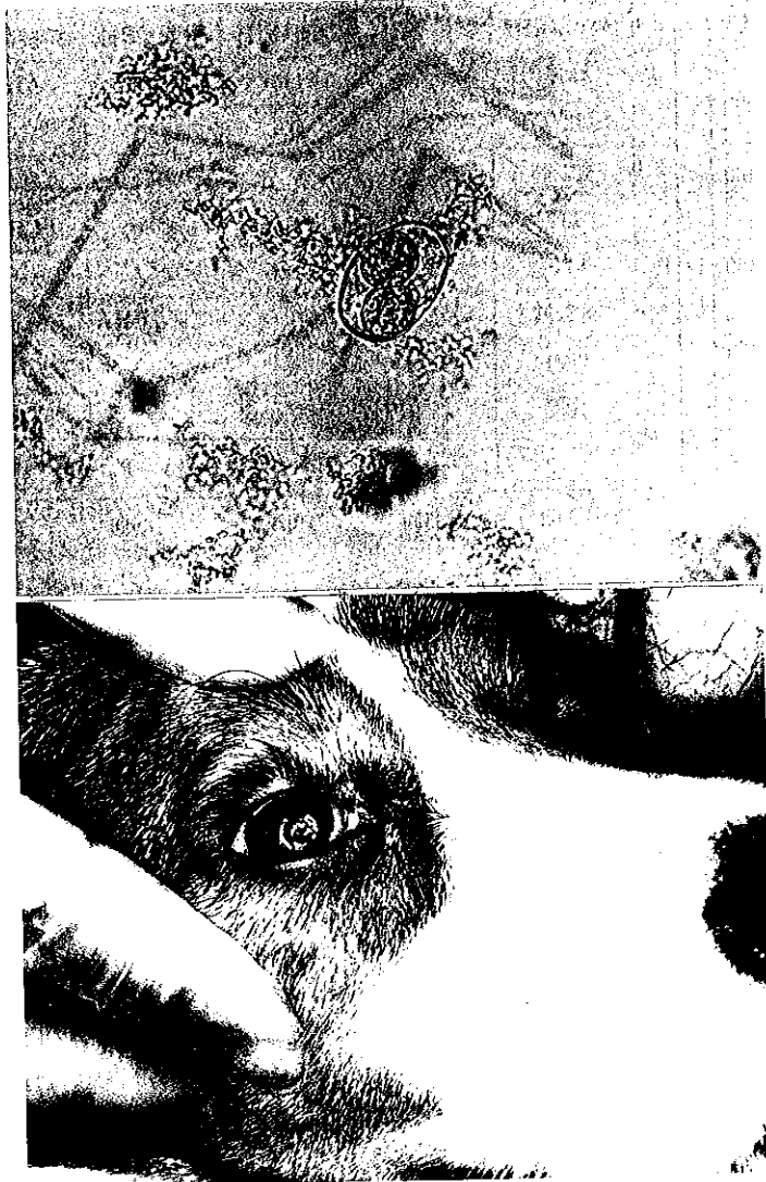
図2 免疫不全により日和見感染を来したビーグル犬 (No.2) 上：糞便中から検出された Isospora canis 。 原虫症の濃厚感染のため重篤な下痢と脱水症状を来した。 下：感染性角膜炎潰瘍から角膜混濁を残した。